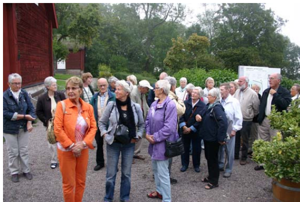
Här är vi samlade inför den intressanta guidningen

Vid Cityterminalen samlades drygt 60 personer för en utflykt till Uppsalatrakten, först Linnés Hammarby, därefter Gamla Uppsala och slutligen centrala Uppsala, gamla delen.